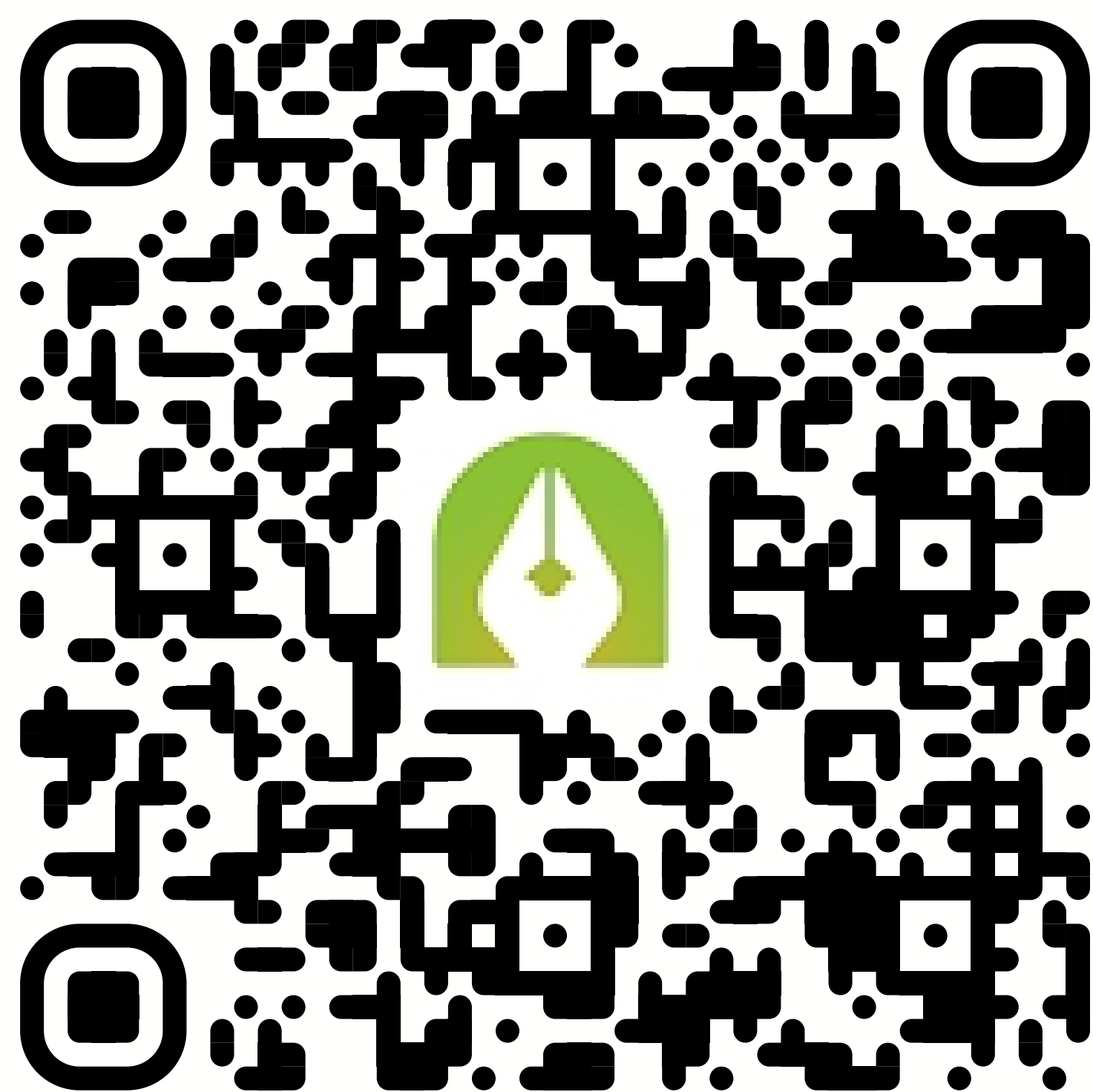
[스터디모아] 앱 설치 QR